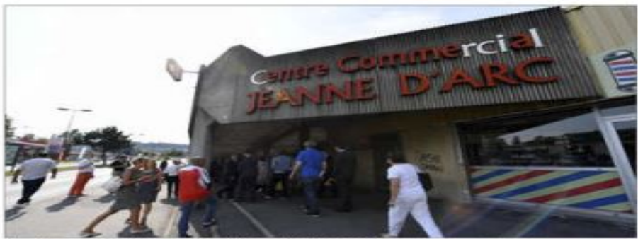
Le centre commercial Jeanne d'Arc doit être démoli en 2022.

Puis, en lieu et place des deux bâtiments de la rue de Harlem, de nouveaux logements neufs devraient être construits un an plus tard, en 2020. Cette même année, des voies vertes s'établiront depuis le parc Poaille jusque dans cette rue. En 2021, un nouveau centre commercial sera construit en face de l'actuel centre Jeanne d'Arc. Particulièrement vieillissant, celui-ci est condamné à disparaître en 2022. La MJC Étoile (détruite en 2024) y sera installée en 2023. Juste en face, le nouveau centre commercial sera entouré de nouveaux logements et d'une place publique toute neuve.